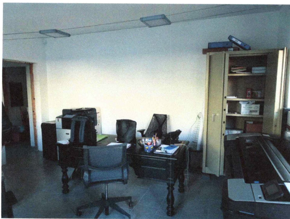
- Ufficio piano terra