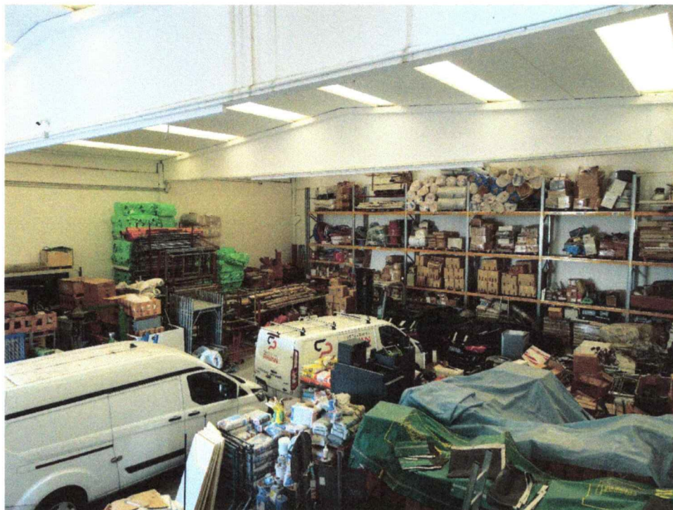
- Vista interna capannone