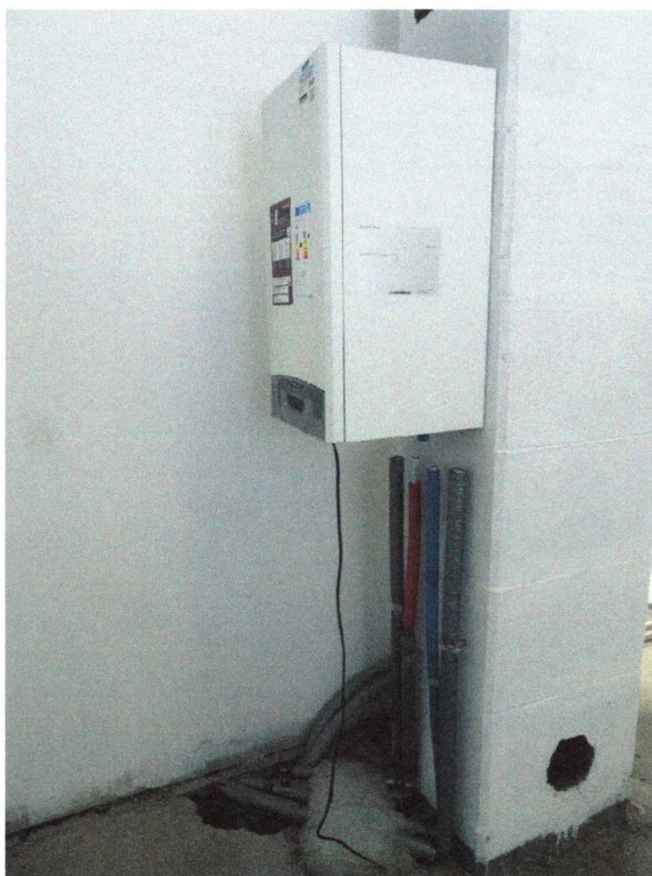
- Locale caldaia primo piano