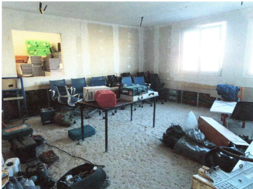
- Ufficio primo piano