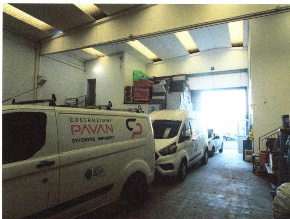
- Vista interna verso portone