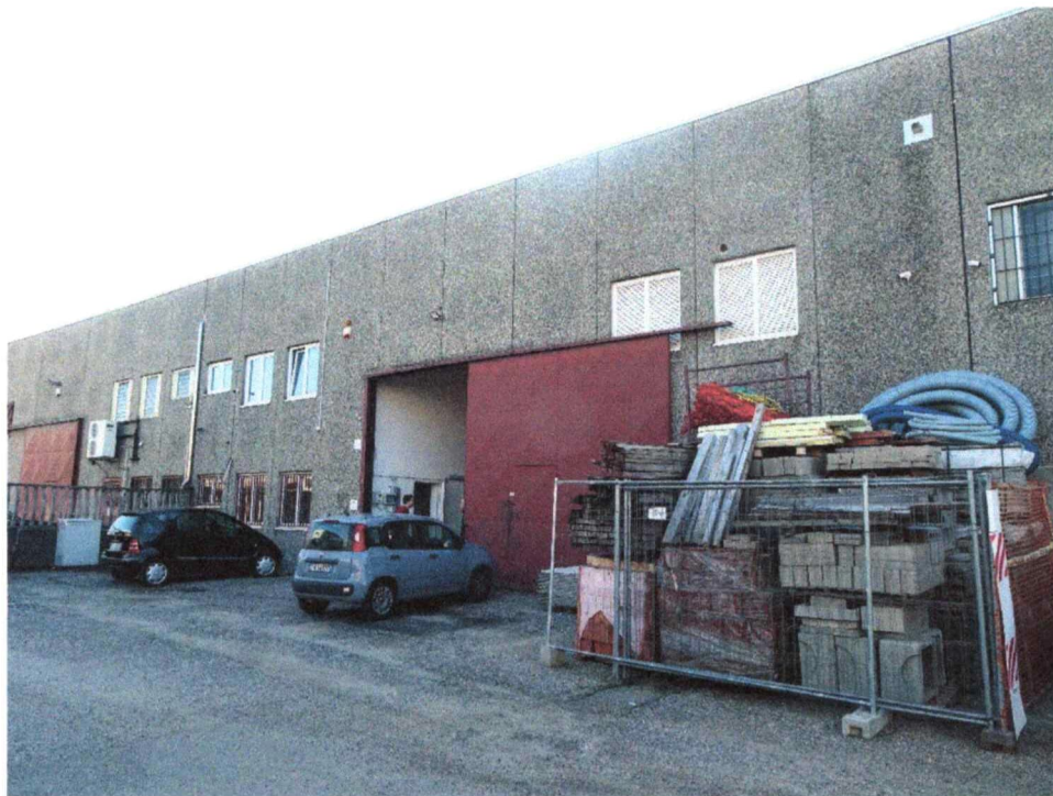
- Vista esterna

Immobile di Via Darwin 35 – Settimo Milanese (MI)