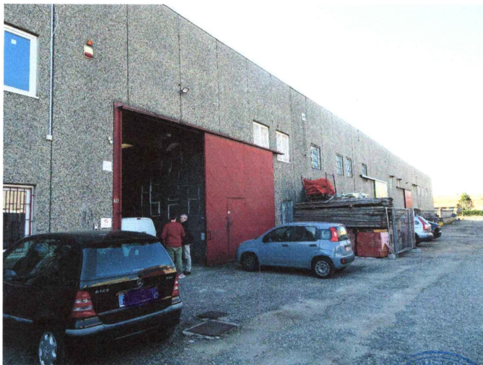
- Vista esterna