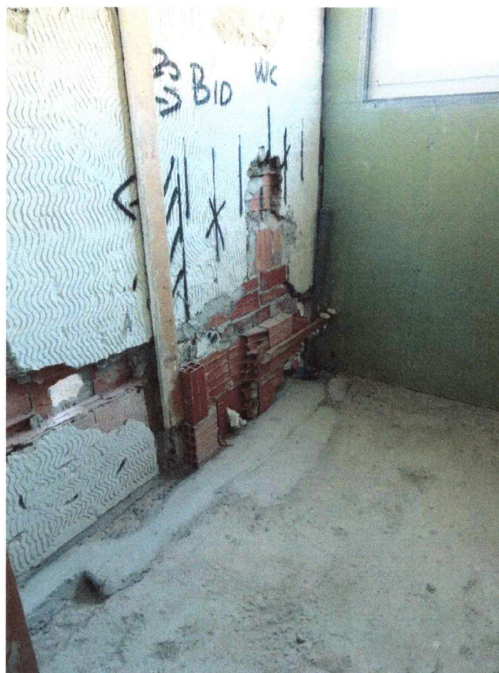
- Bagno primo piano