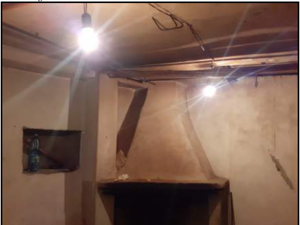
Foto 32. Camino ubicato ad angolo pareti