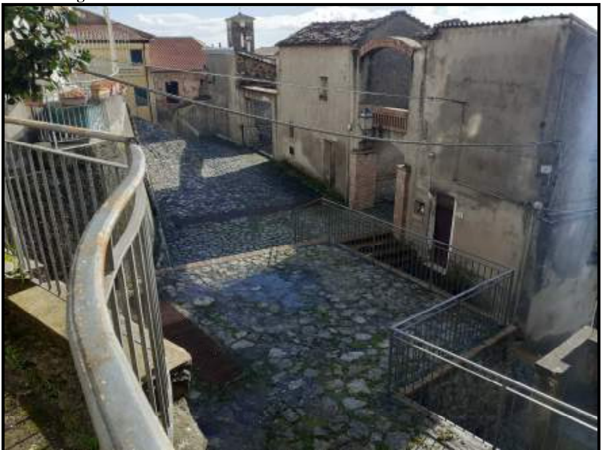
Foto 26. Area esterna pavimentata in pietra che da accesso a locali con civici n° 15-17