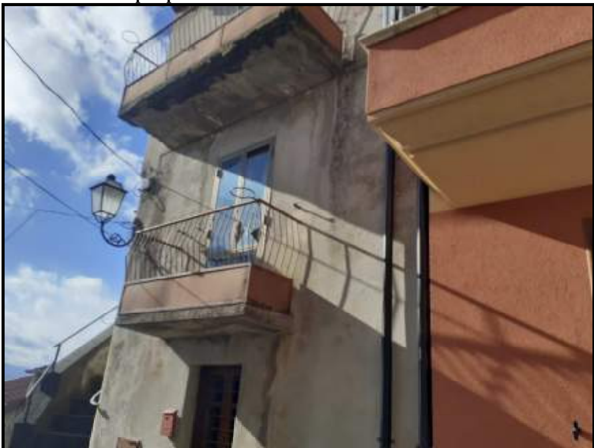
Foto 6. Vista solette balconi prospetto est