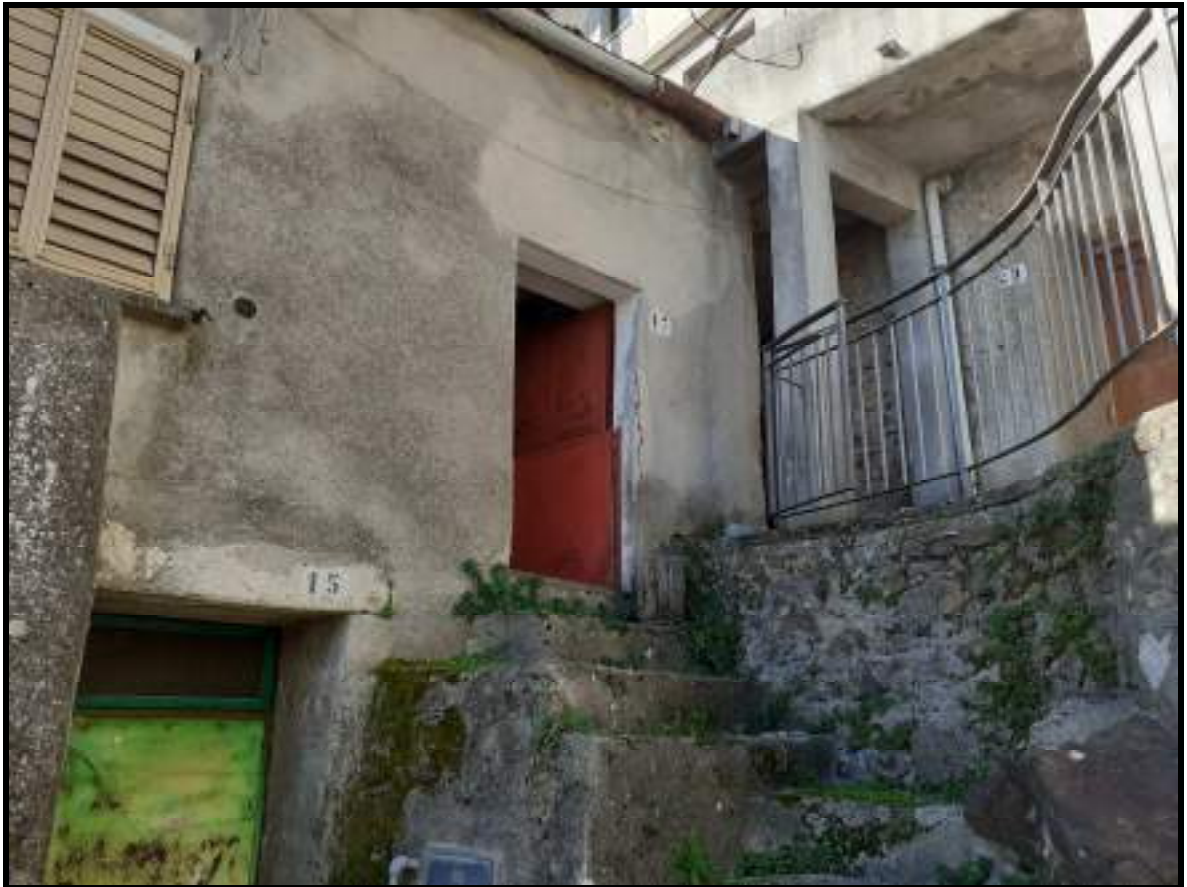
Foto 25. Ingressi ai civici 15-17 e 21