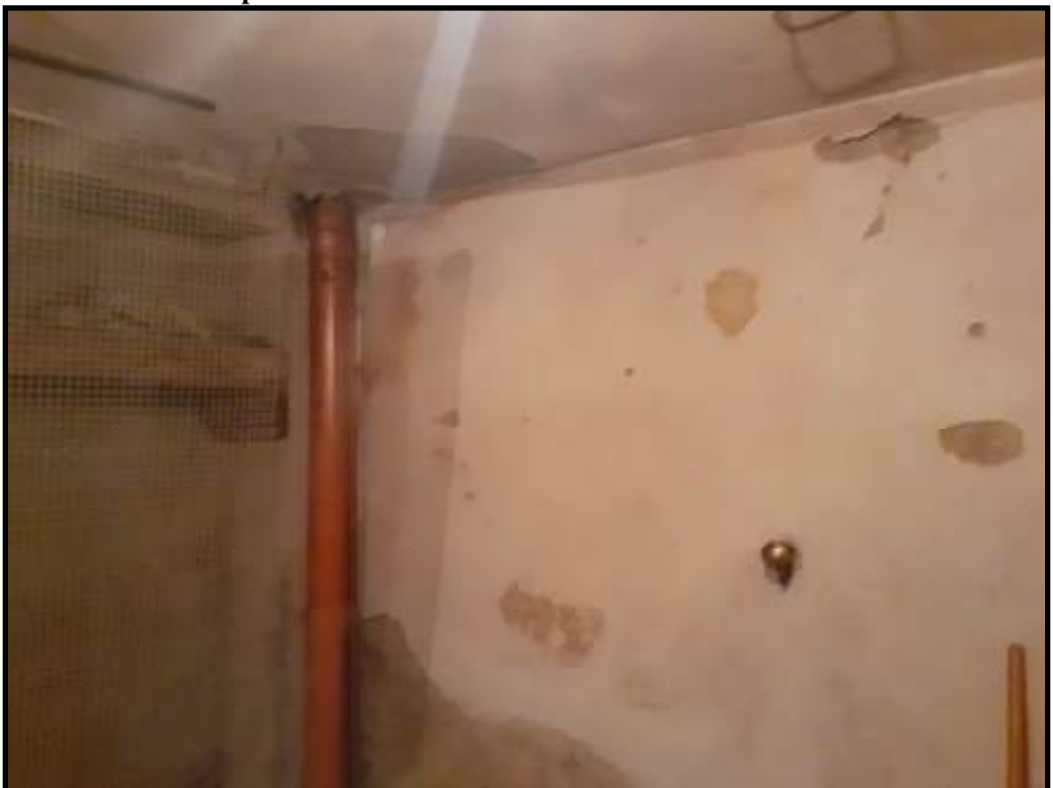
Foto 34. Vista soffitto e angolo pareti con tubo di scarico del wc del piano superiore