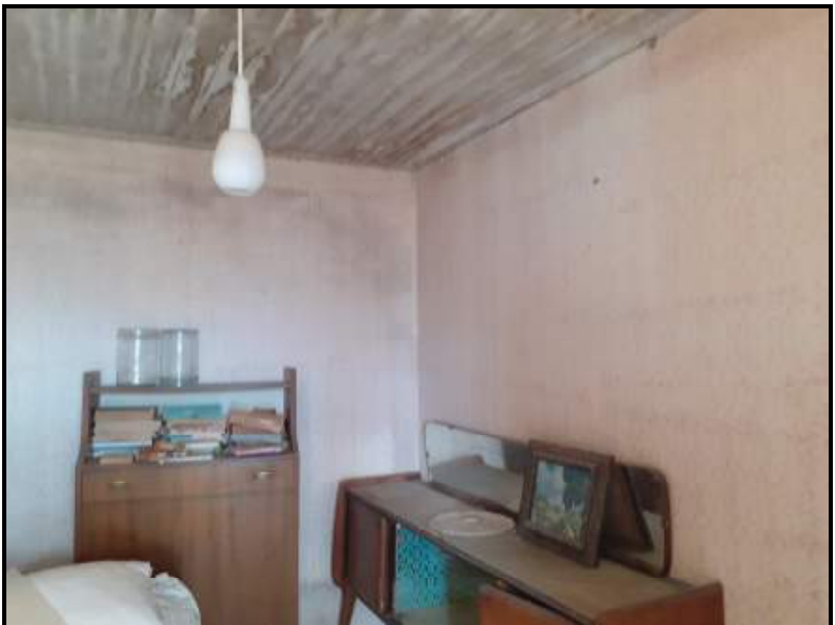
Foto 20. Altre pareti e soffitti secondo vano