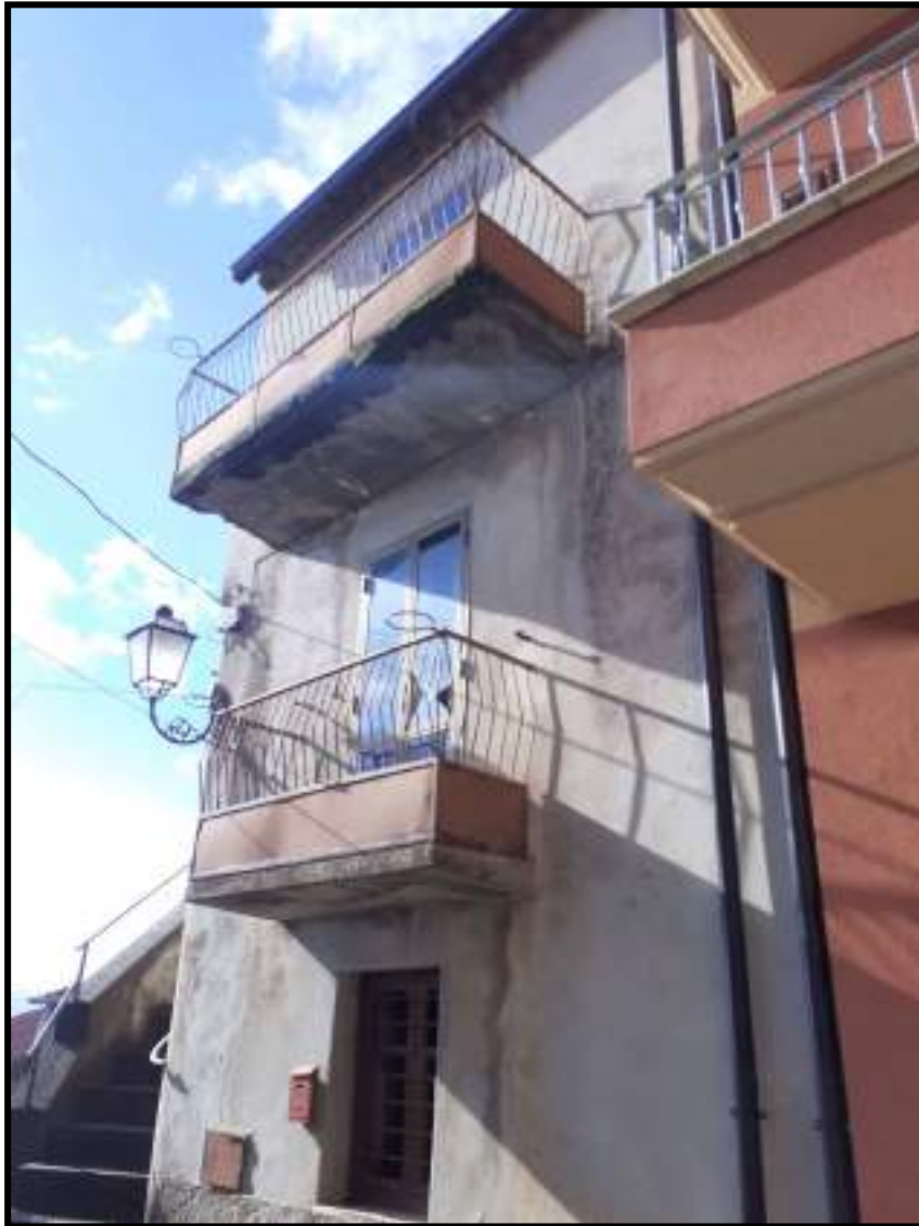
Foto 3. Vista prospetto lato est appartamento