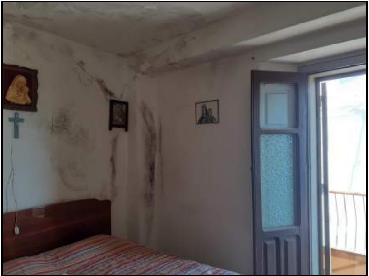
Foto 11. Vista pareti e soffitto piano primo