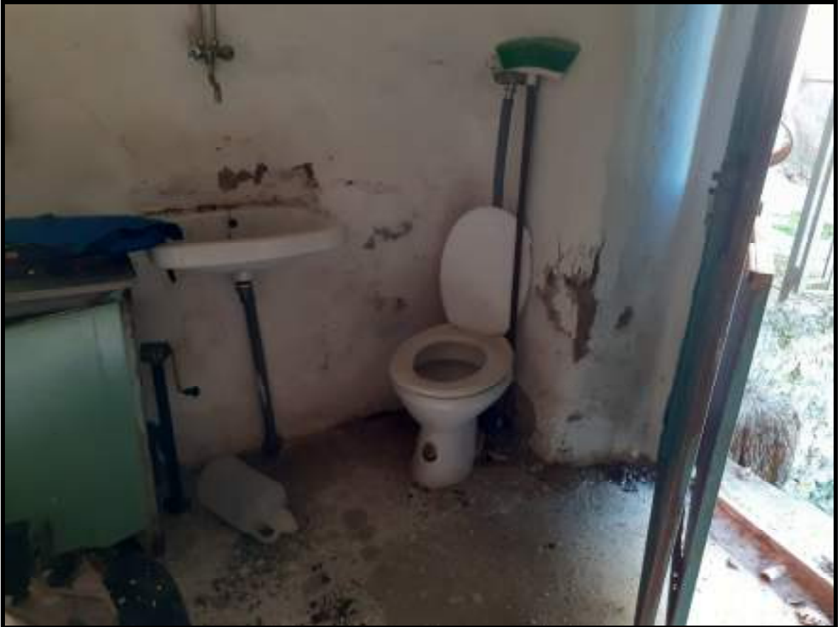
Foto 27. Ingresso con wc e lavello al civico 17