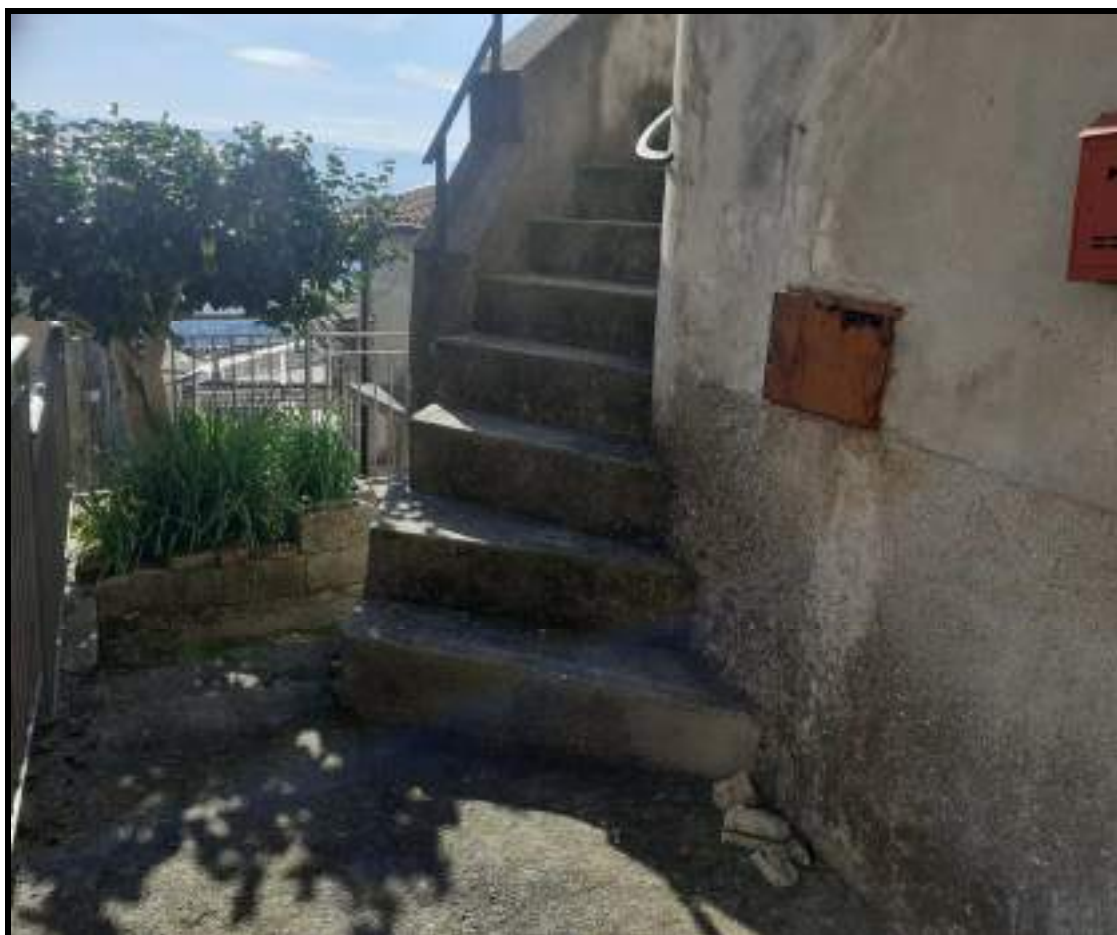
Foto 7. Scala di accesso ad appartamento