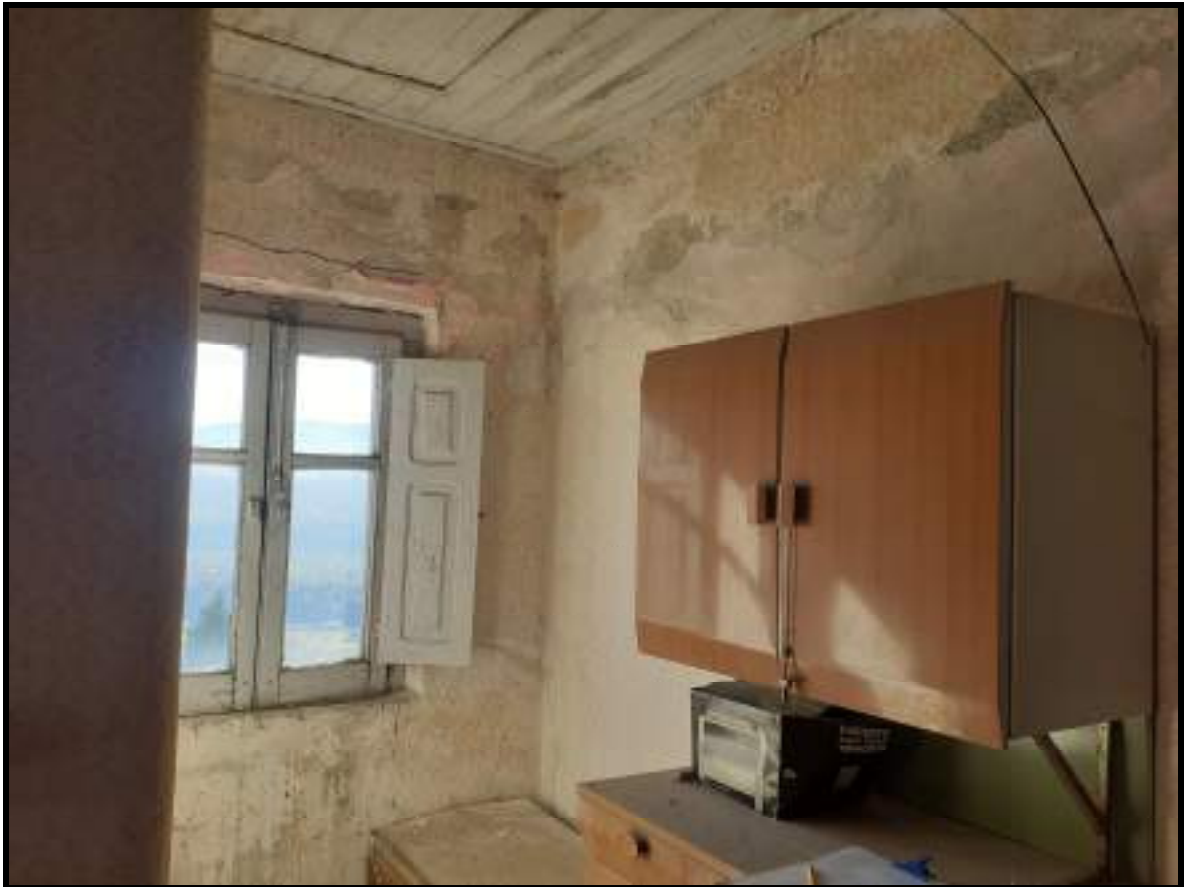
Foto 19. Finestra lato sud e botola al soffitto nel secondo ambiente