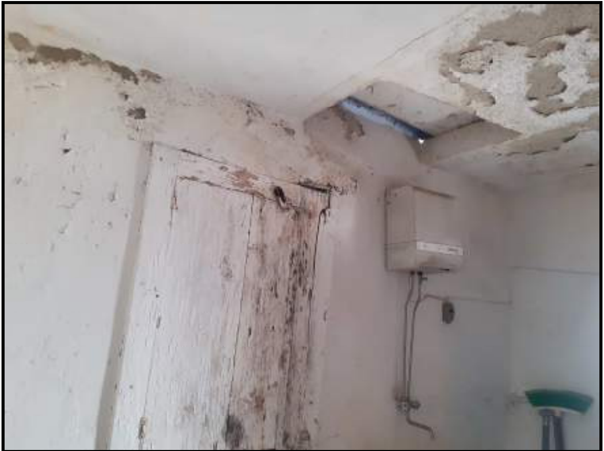
Foto 29. Pareti e soffitto civico 17