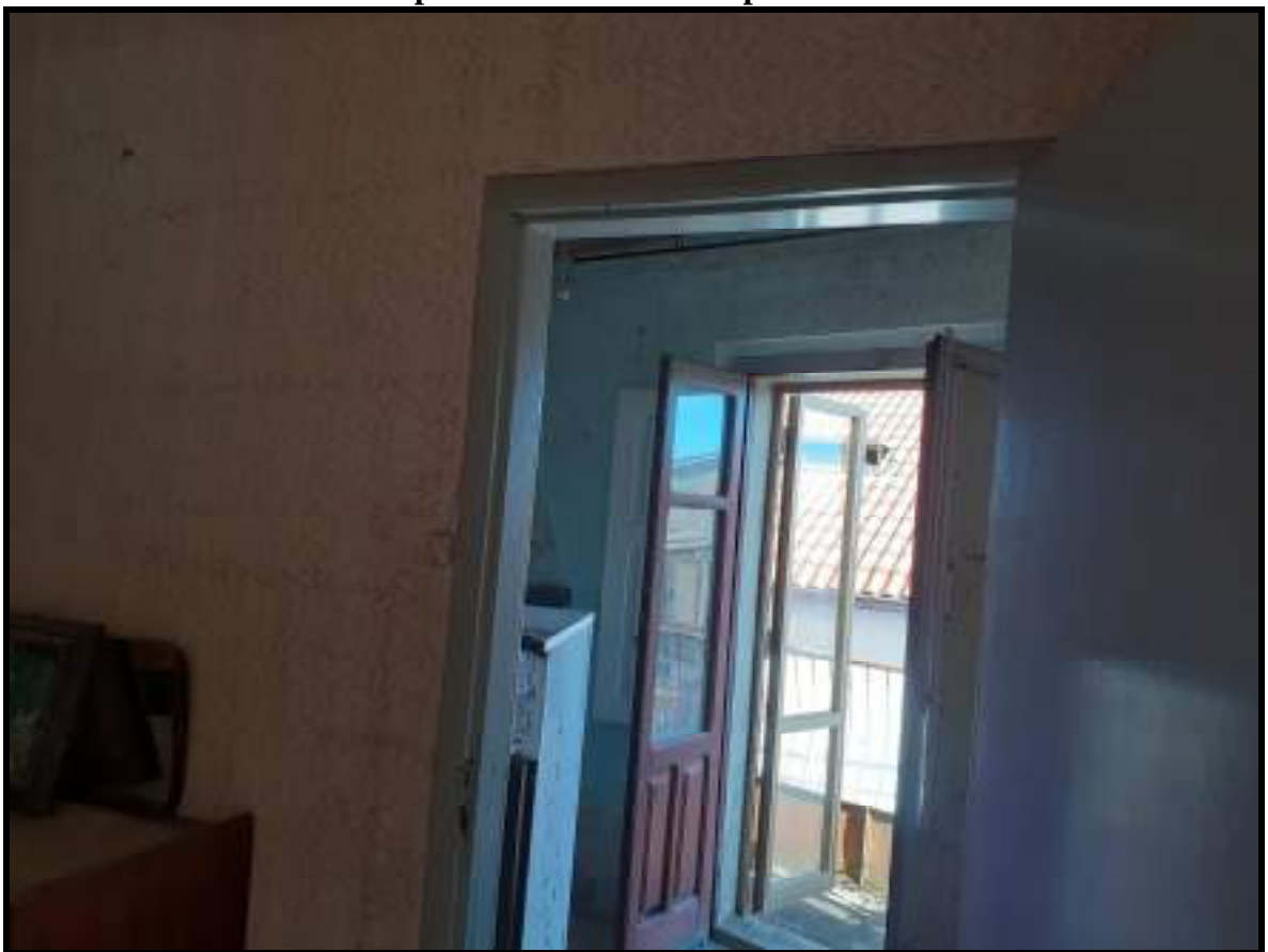
Foto 18. Porta di accesso da primo a secondo locale