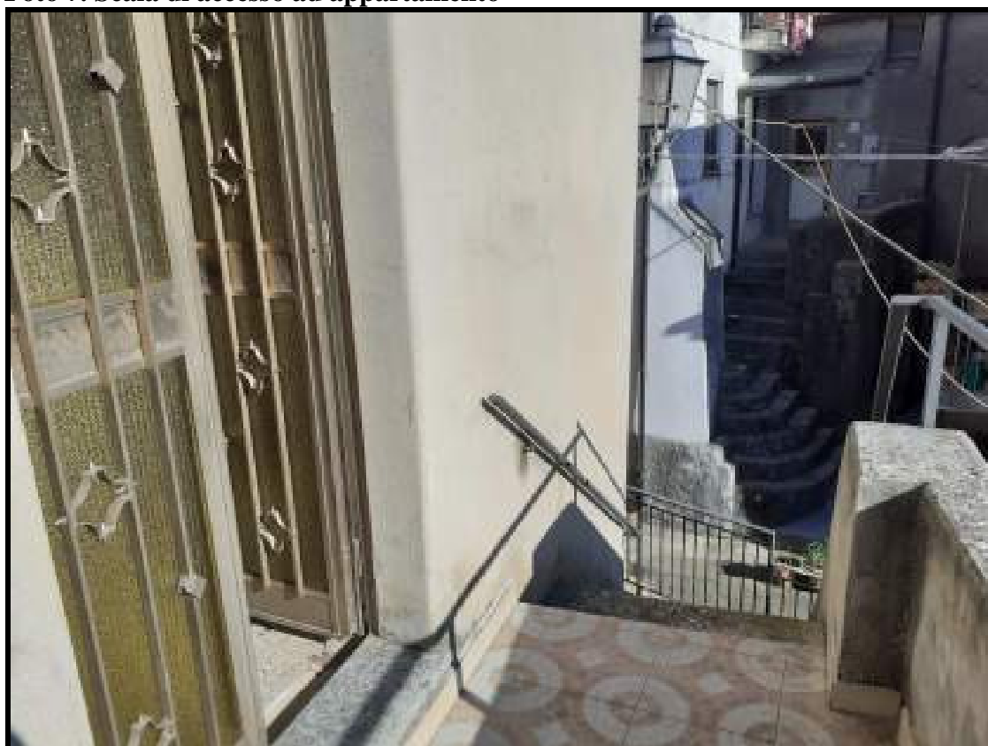
Foto 8 Pianerottolo e porta di ingresso all'appartamento