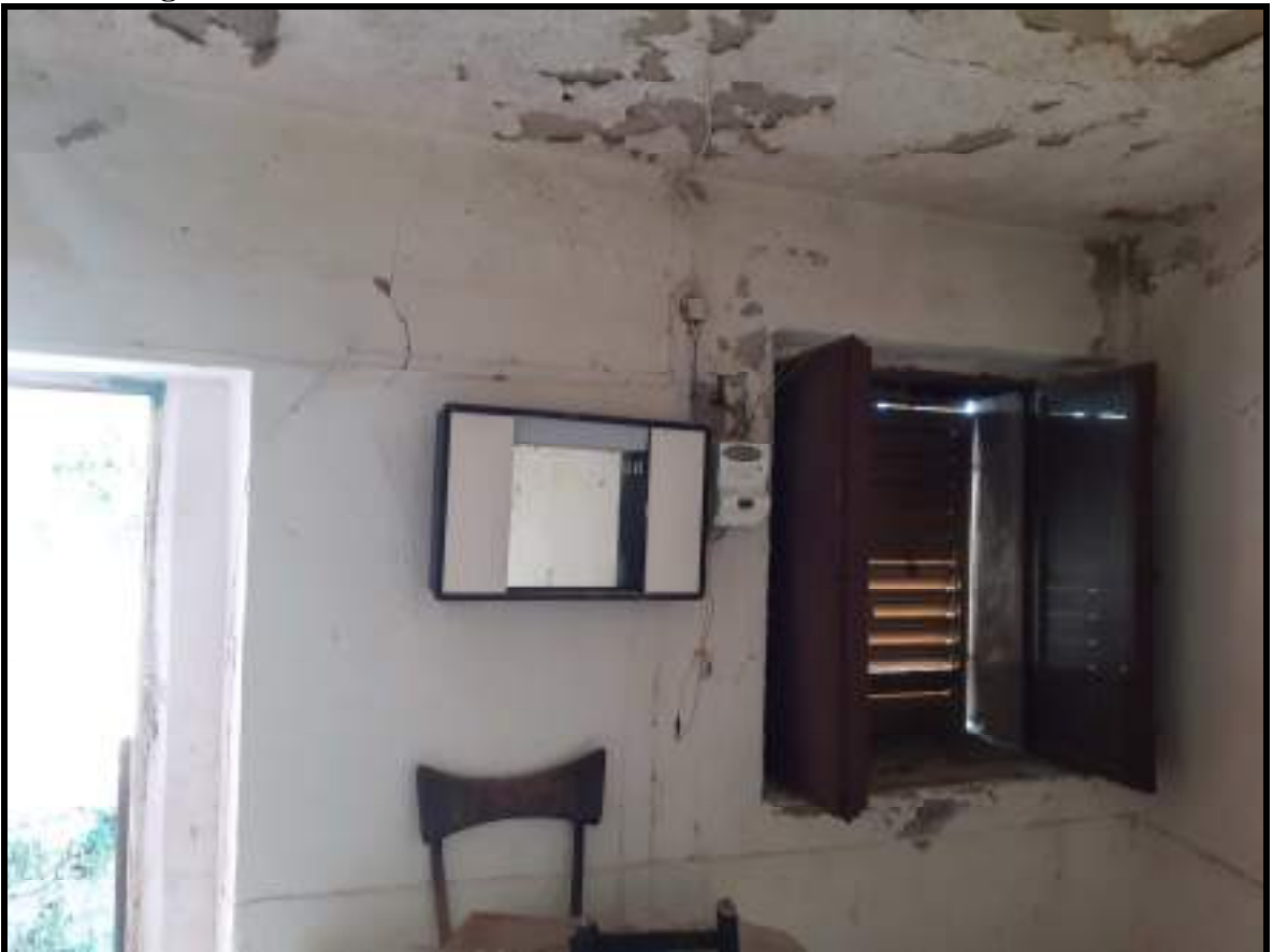
Foto 28. Ingresso e infisso al civico 17