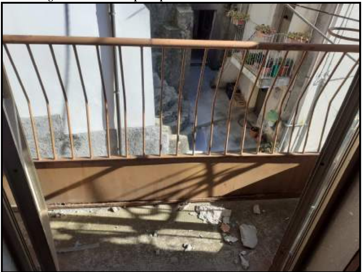
Foto 14. Particolare balcone piano primo