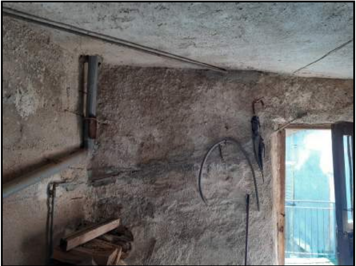
Foto 21. Ingresso muri e soffitto cantina al civico 21