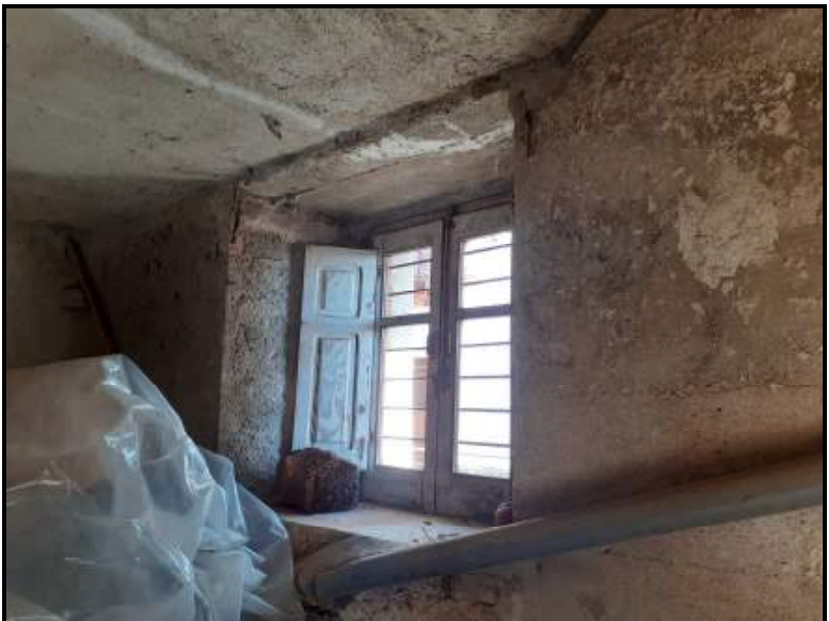
Foto 24. Muro lato est con finestra locale cantina