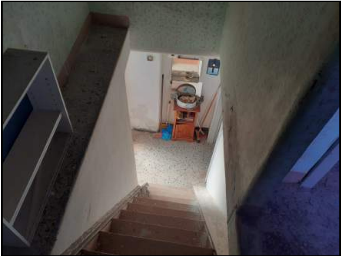
Foto 15. Scala di accesso da ingresso a piano secondo dell'immobile