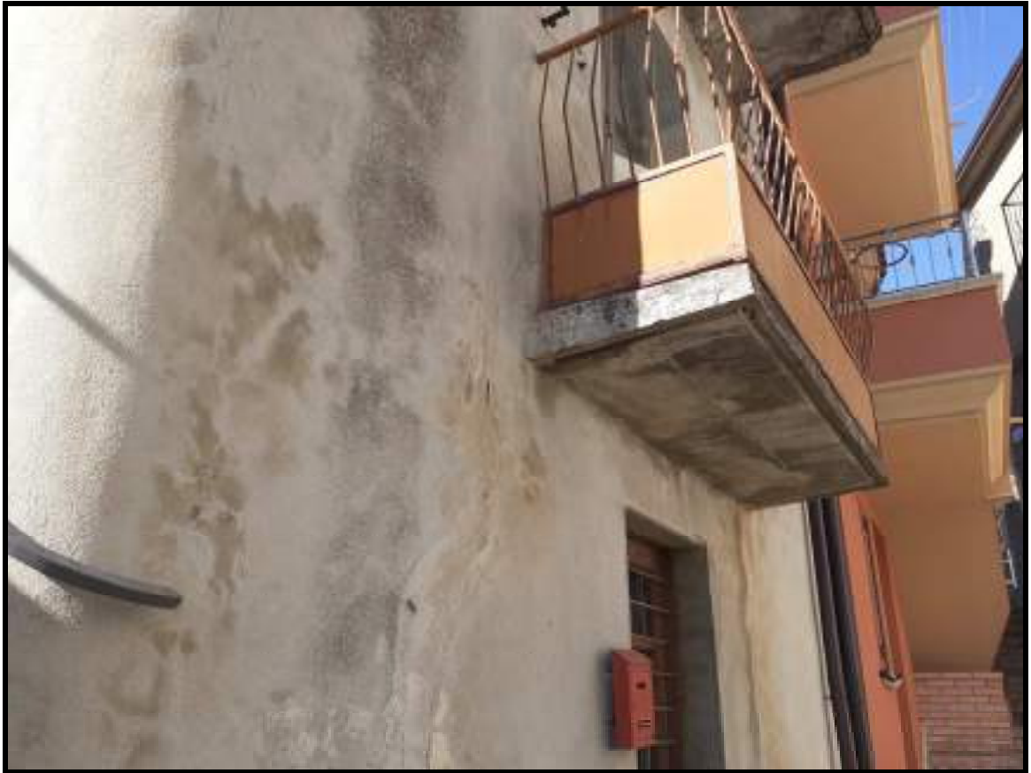
Foto 5. Particolare prospetto est