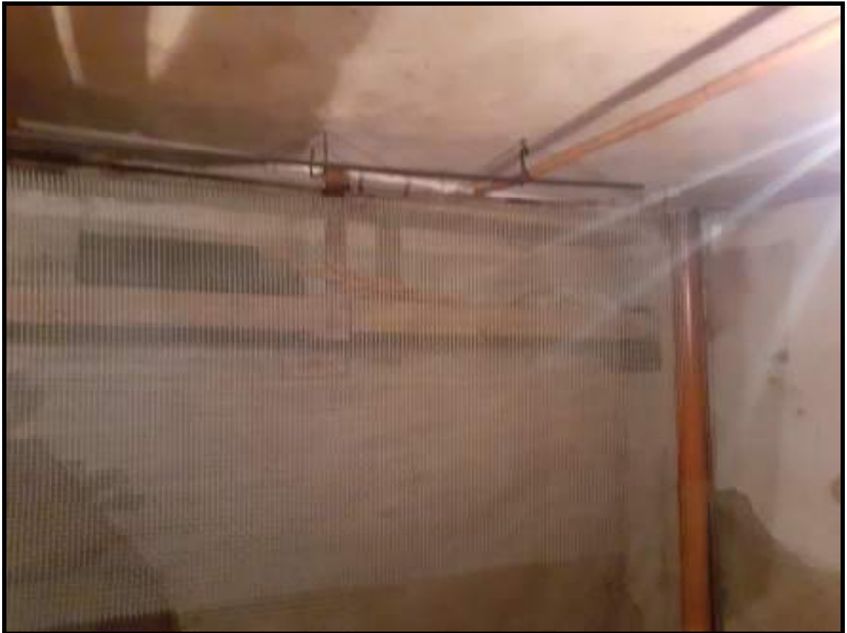
Foto 33. Vista altre pareti e soffitto