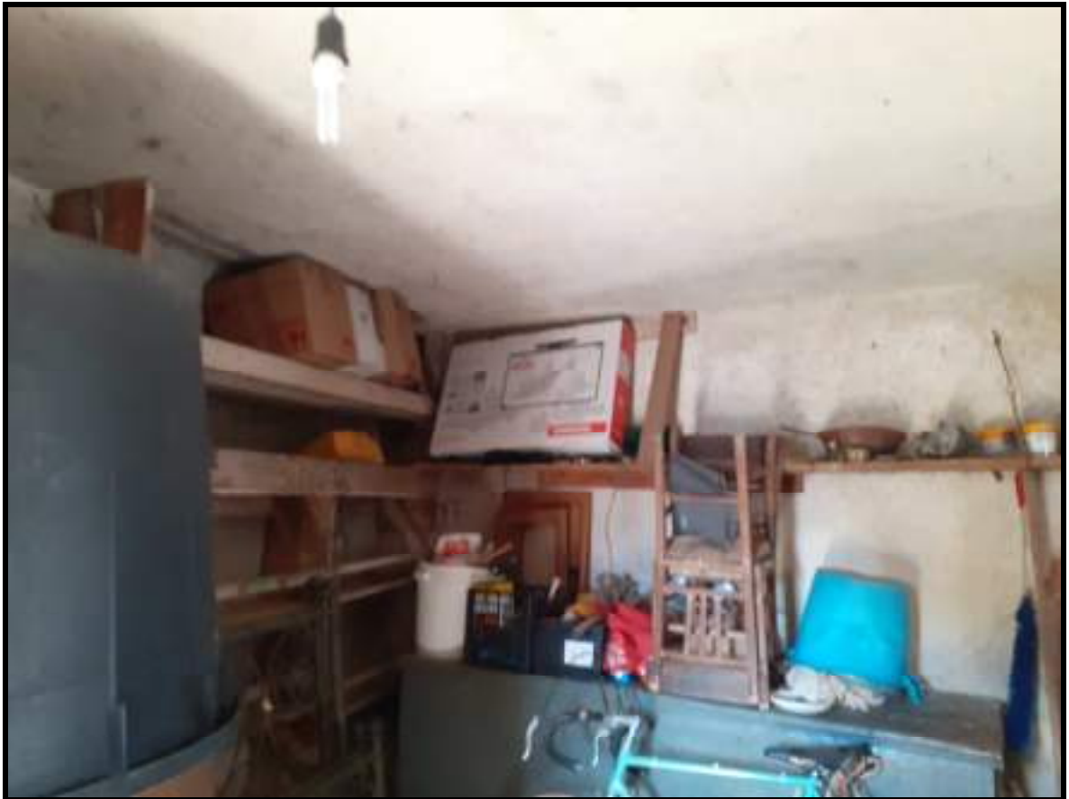
Foto 23. Muri e soffitto locale cantina