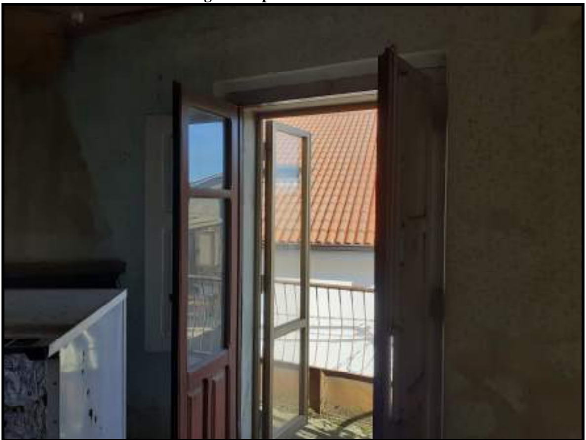
Foto 16. Balcone posto nel primo locale al piano secondo