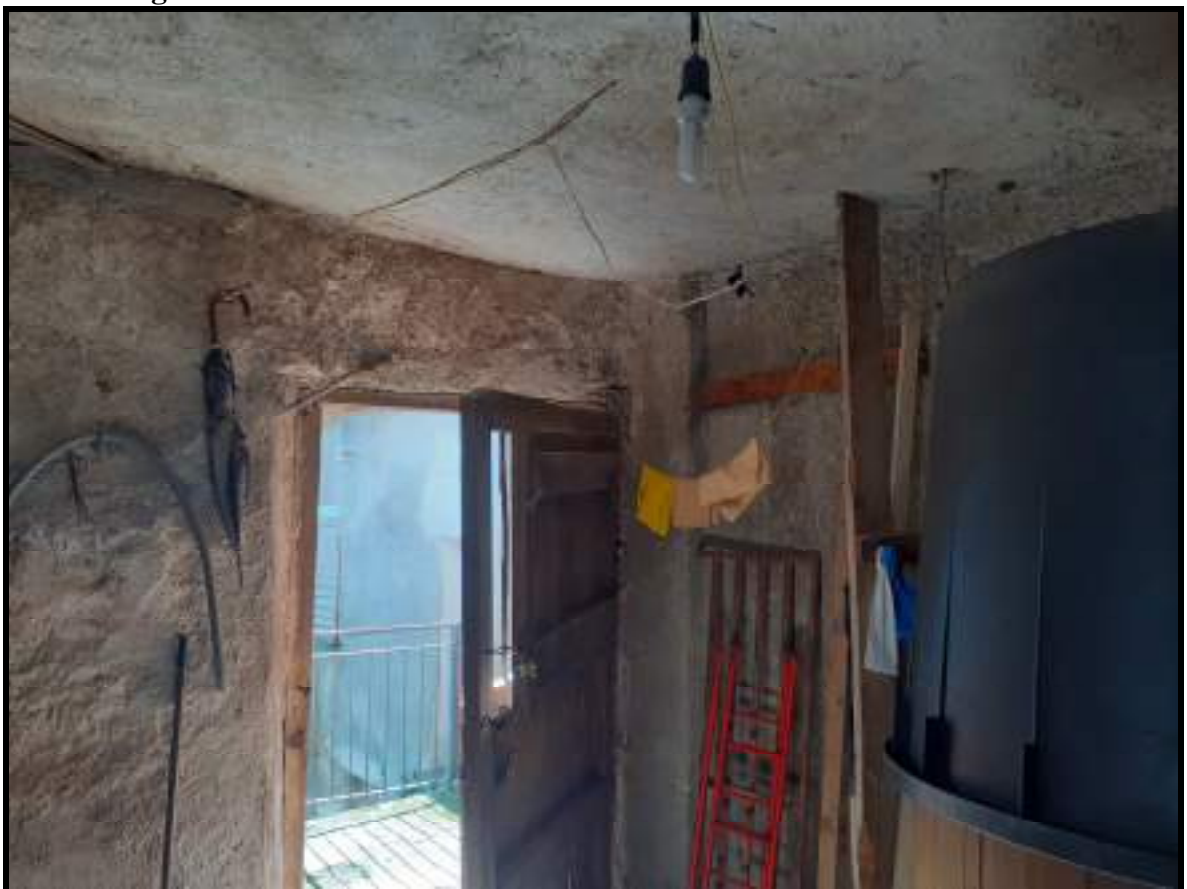
Foto 22. Altra vista ingresso cantina