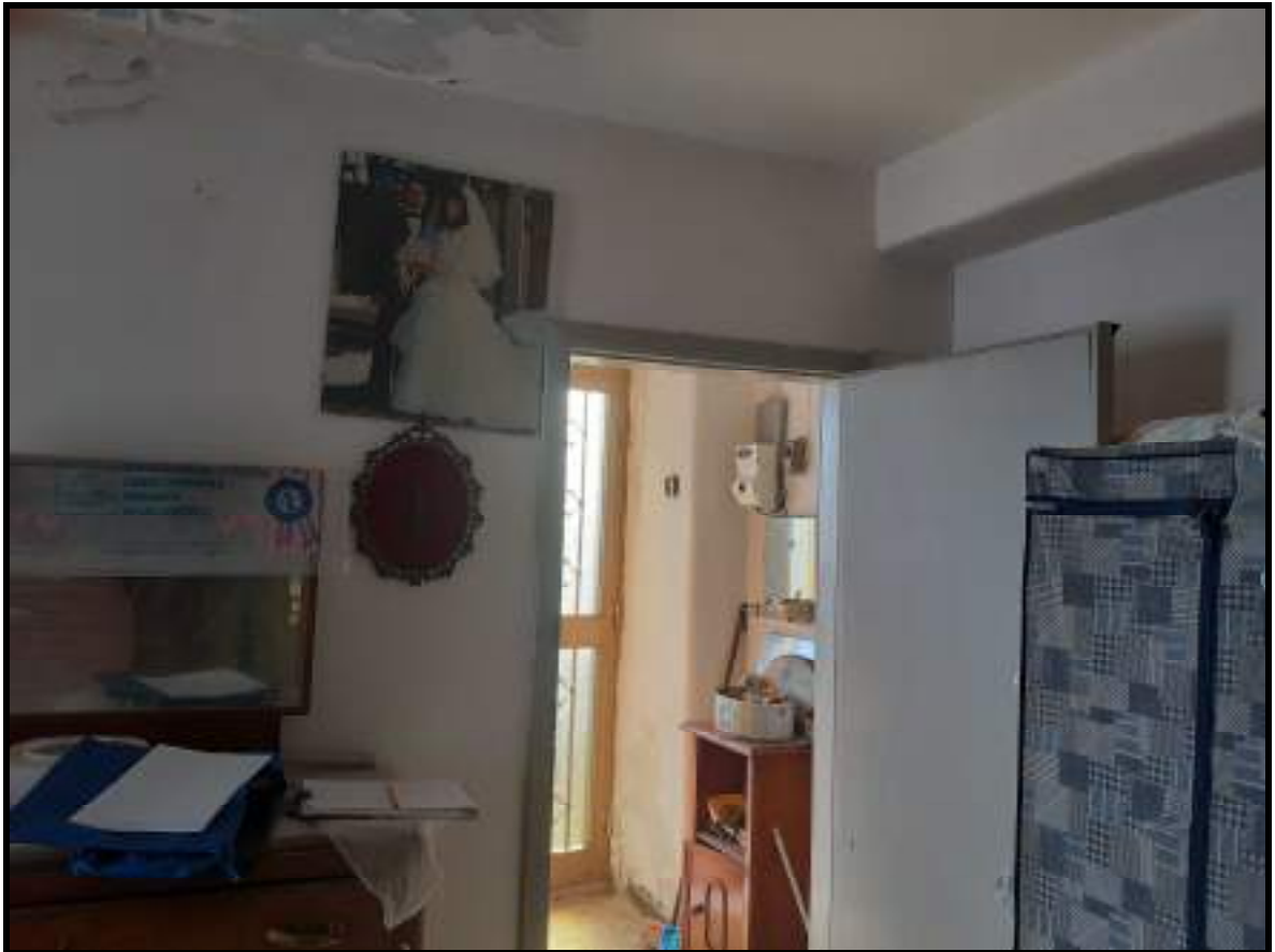
Foto 9 Ingresso con disimpegno a piano primo