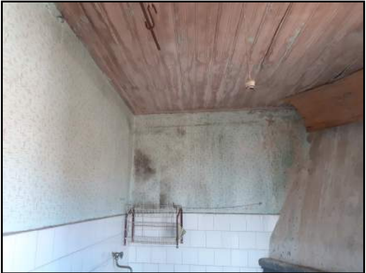
Foto 17. Pareti e soffitto del primo locale cucina al piano secondo