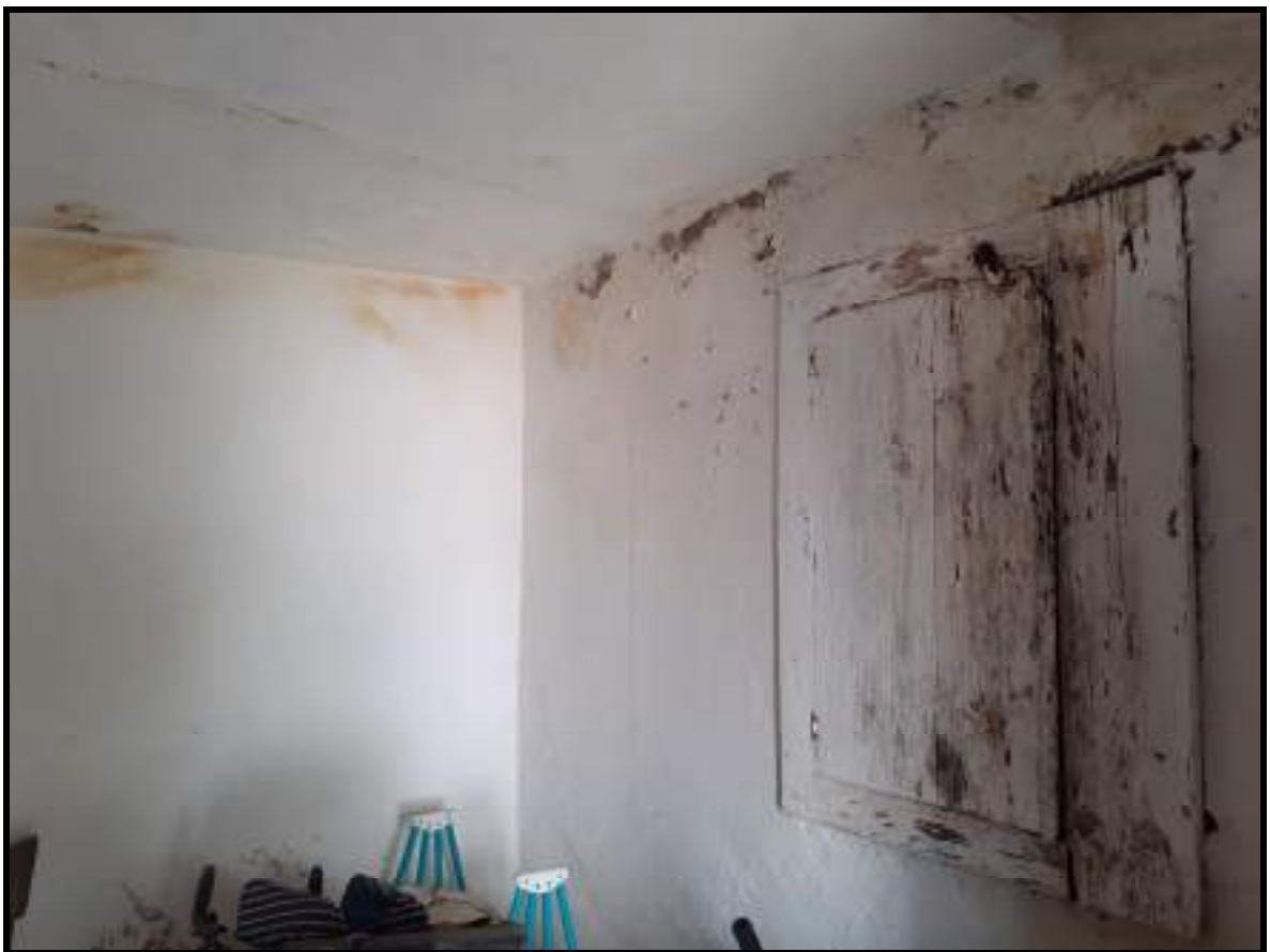
Foto 30. Altra vista pareti e soffitto civico 17