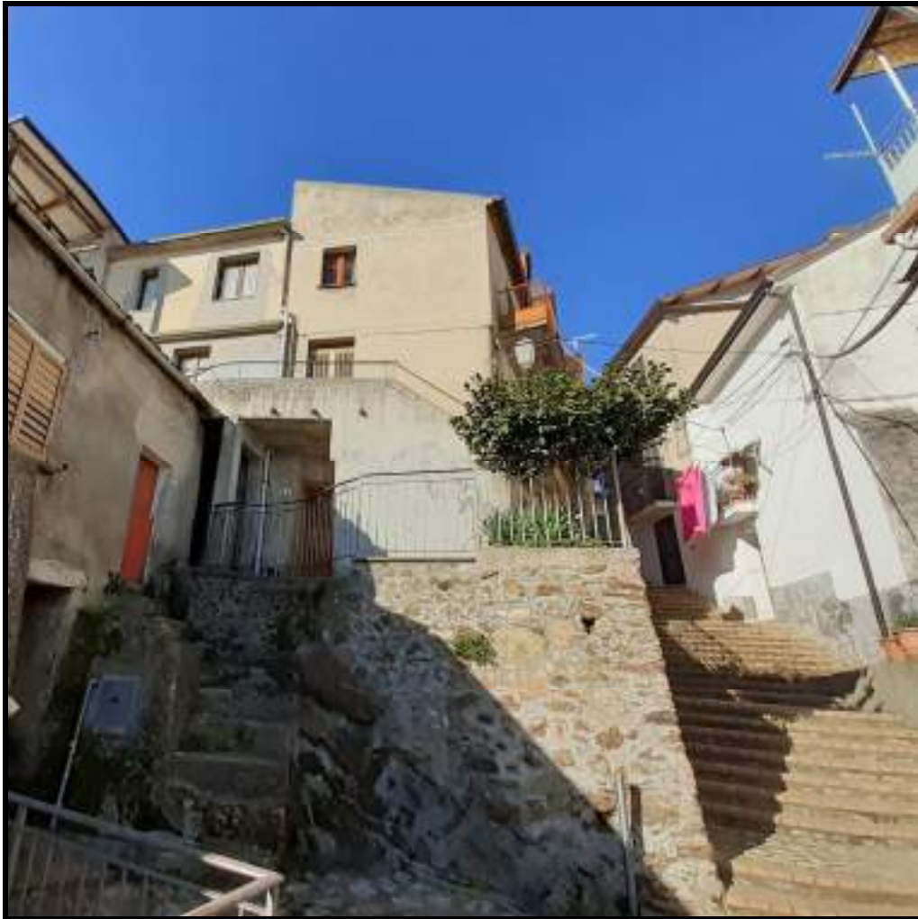
Foto 1. Vista dal basso di salita Garibaldi e delle unità immobiliari