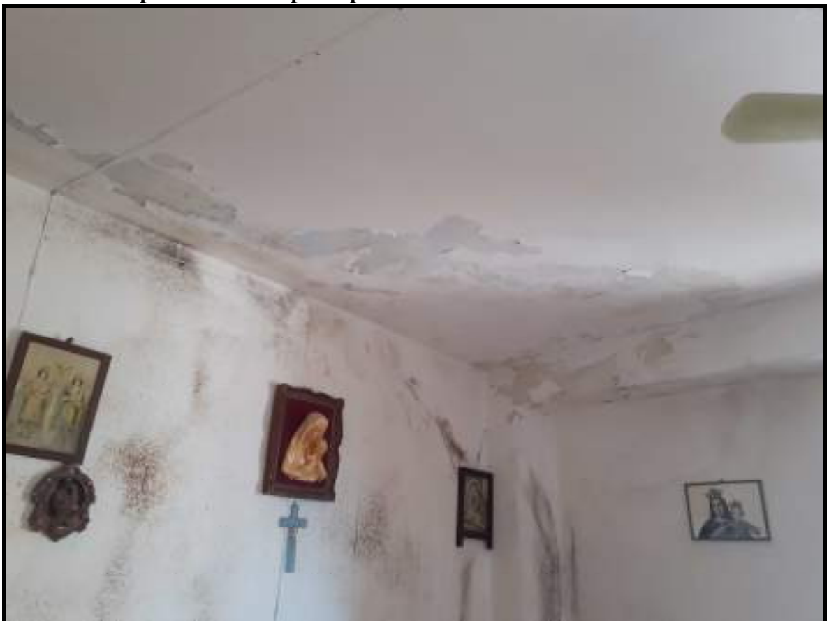
Foto 12. Altra vista pareti e soffitto piano primo