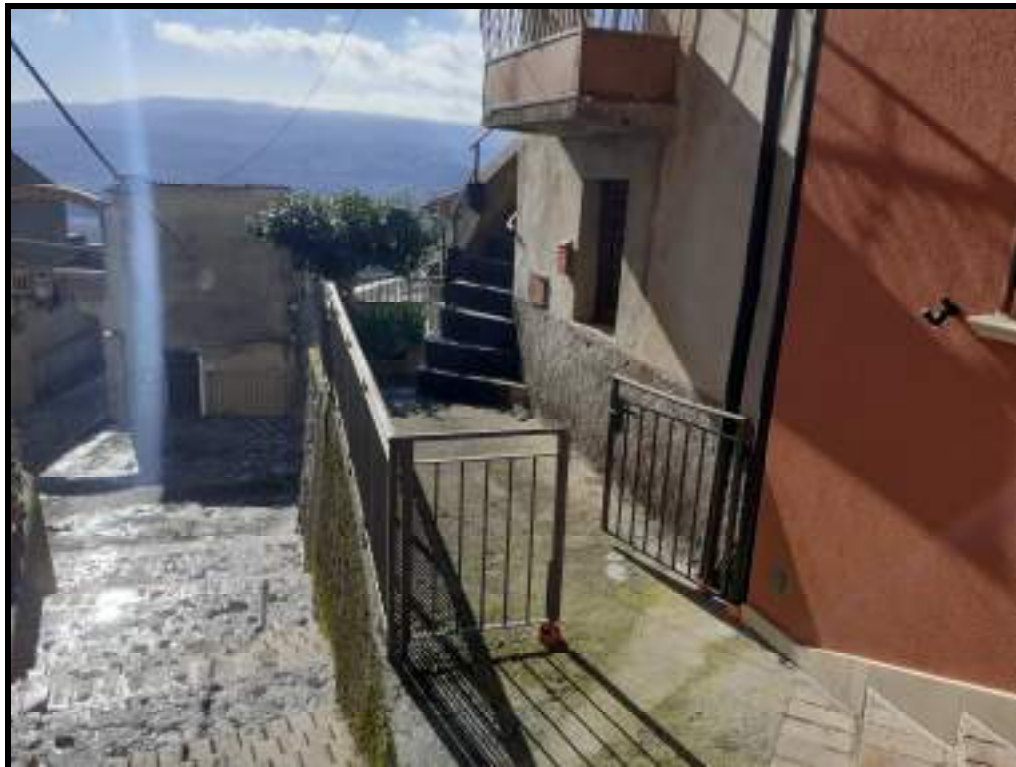
Foto 2. Vista dall'alto di salita Garibaldi con ingresso al pianerottolo e rampa scala