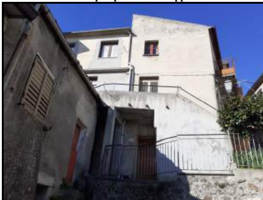
Foto 4. Vista prospetto lato sud di ingresso appartamento