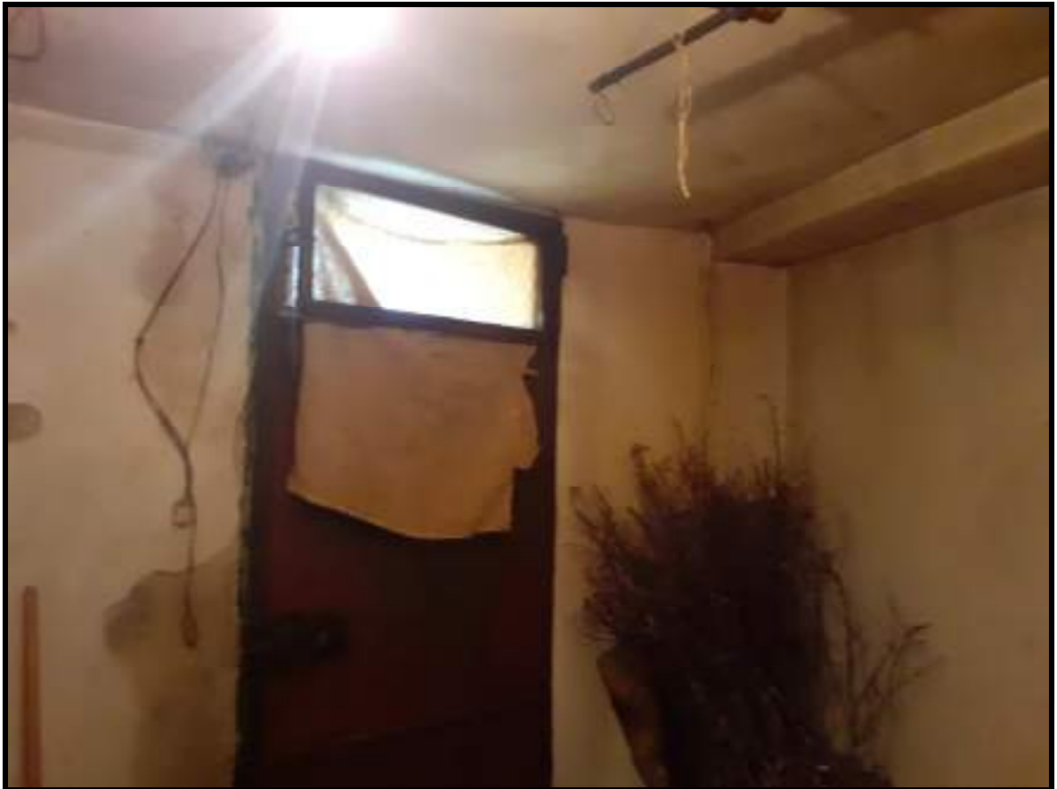
Foto 31. Ingresso cantina al civico 15