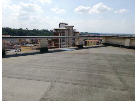
Accesso al piano 12° dalla scala condominiale, vista lastrico sub. 116

Nota: con riguardo allo stato di conservazione, il fabbricato nel suo complesso, può trovarsi in condizioni: ottime, buone, normali, scadenti e degradate.