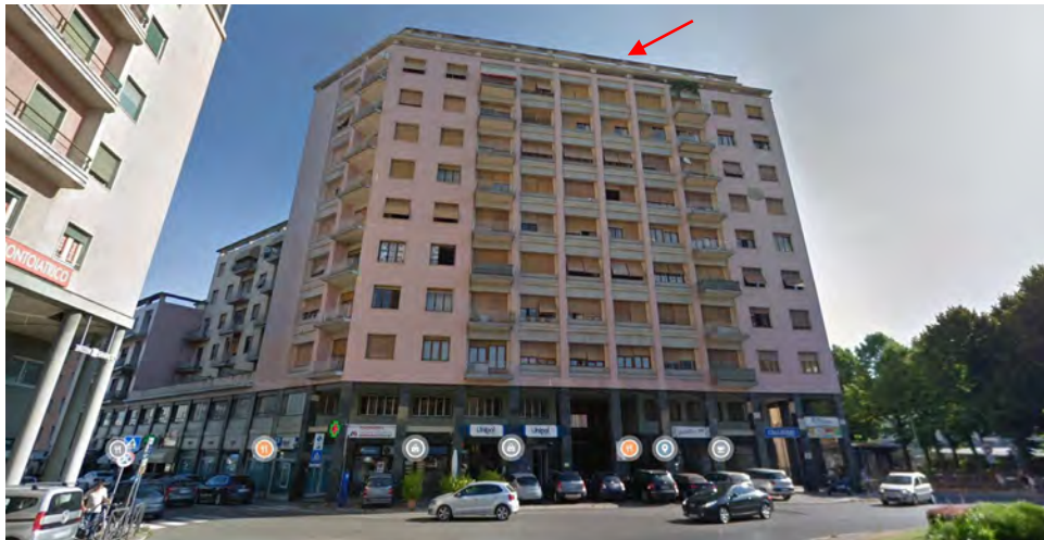
Inquadramento territoriale - vista del fabbricato e individuazione lastrico solare