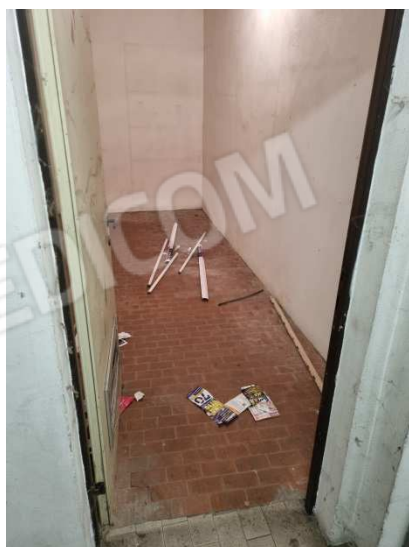
un locale C2 del corpo D