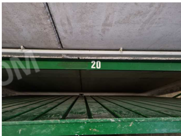
Rampa di discesa ai box interrati