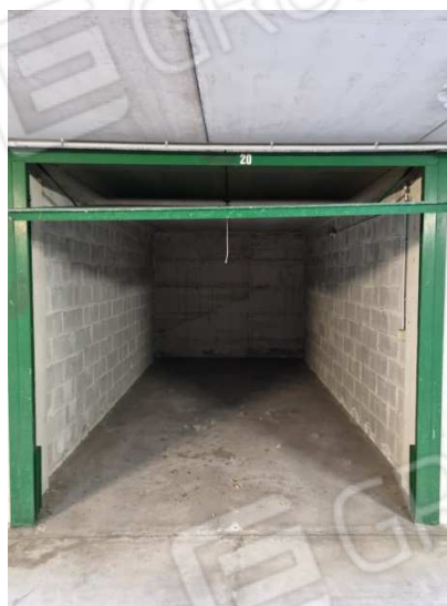
campione locali box